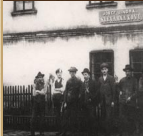
1909 – začátek podnikání v Národním domě v České Třebové