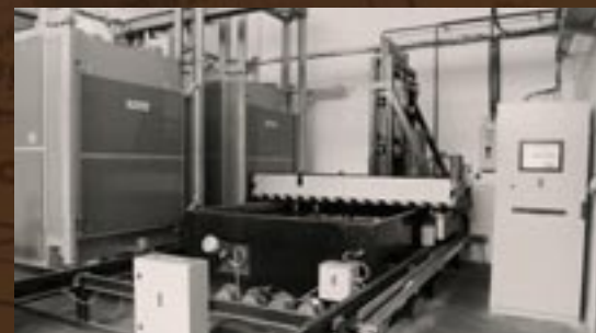
Linka pro tepelnou úpravu hliníkových výkovků