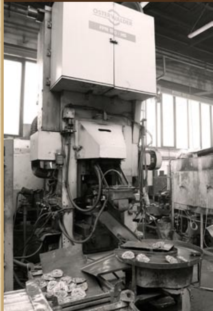
Automatická kováčnická linka s lisem OSTERWALDER FPN 180

Nástrojárna se orientuje na návrh, konstrukci a výrobu nářadí, výrobu prototypových dílů a nástrojů. Pro návrh a konstrukci je užíván CAD / CAM software Unigraphics a Solid Edge. Pro vlastní výrobu nástrojů se používají klasické nebo CNC obráběcí stroje včetně vysokorychlostní CNC frézy.