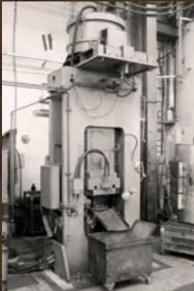
Lis MW 180 s průběžnou pecí