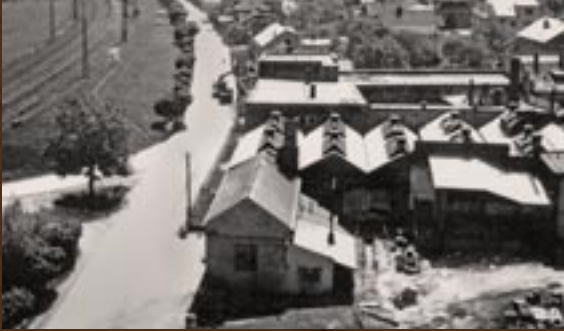
1972 - čekání na lepší časy