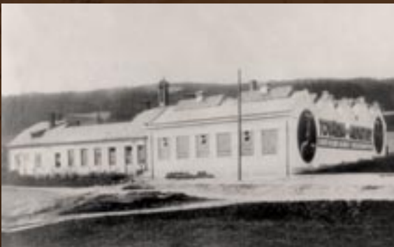
1922 - firma roste a prosperuje