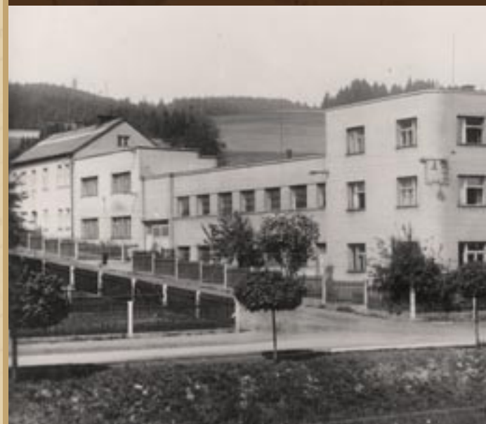
1938 - období největšího rozkvětu