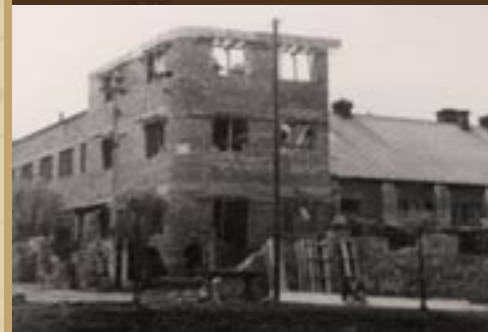
1930 - další přístavba

Národní správu, která byla do závodu dosazena 5. 3. 1948, vykonávaly Československé kovodělné a strojírenské závody Praha.