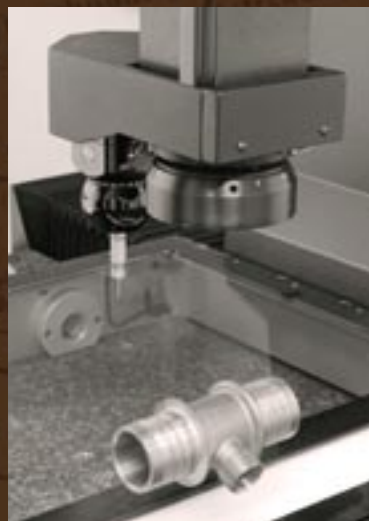
3D měřicí přístroj firmy WERTH