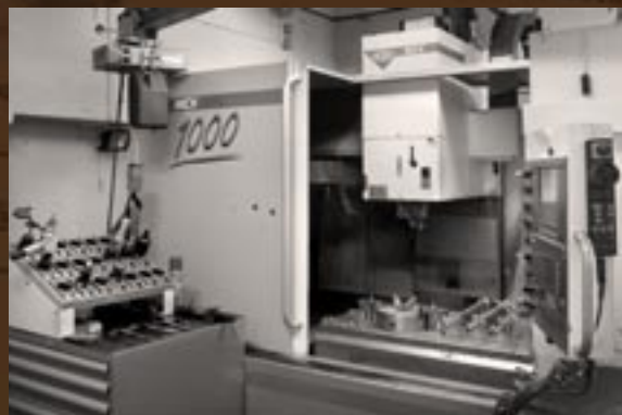
Frézovací centrum MCV 1000